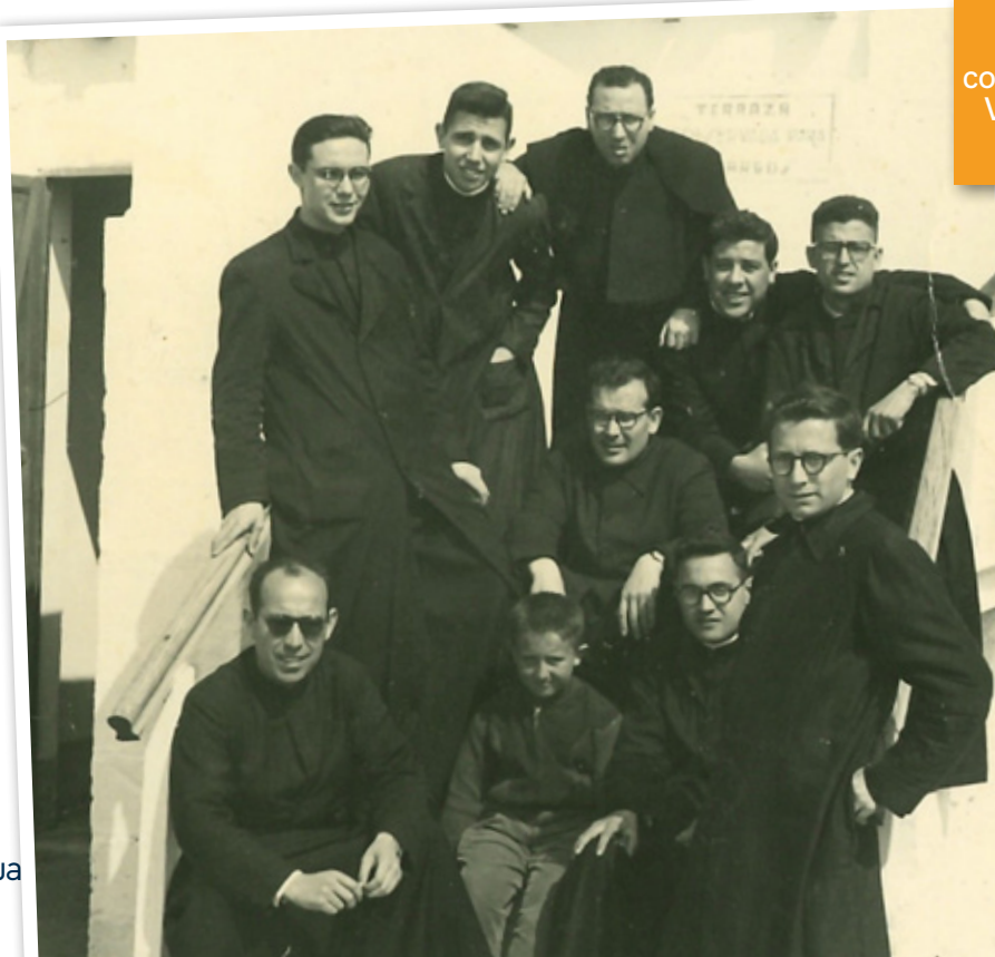
Padres “jóvenes” de la comunidad de Escuelas Pías de Valencia en día de excursión Curso 1953-54

Una sección para recuperar fotografías antiguas de nuestros Archivos que testimonian el trabajo y el esfuerzo de todos los que han ayudado a levantar y sostener la obra de Calasanz.