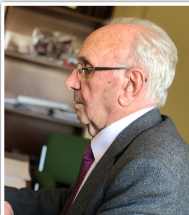
El P. Ángel, en un momento de la entrevista

En 1976 viajaría hasta Sevilla, donde vivió el traslado del cole-